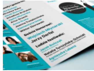
Obsługa graficzna Festiwalu Twórczości Wojciecha Młynarskiego