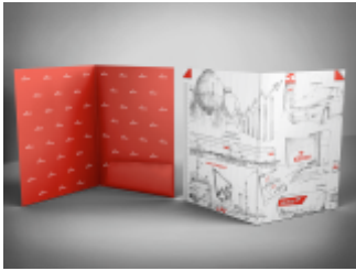
Teczka PCV na dokumenty Orlen Gaz