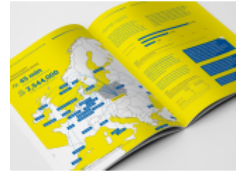
Projekt i skład DTP raportu „Częstochowa – nowa lokalizacja na mapie usług biznesowych”