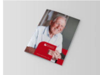
Projekty graficzne dla firmy Pflegehilfe Schweiz