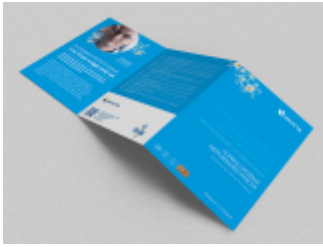
Projekty graficzne dla Kliniki i Laboratorium Medycznego Invicta