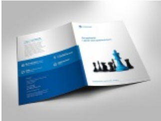
Projekt broszury firmowej dla spółki E-Kancelaria