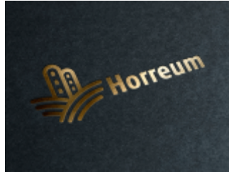
Logo spółki Horreum