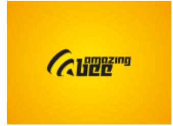
Projekt logo Amazing Bee