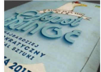
Fringe Festival projekty graficzne