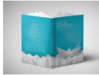
Projekt okładki książki „Stać się jak dziecko”