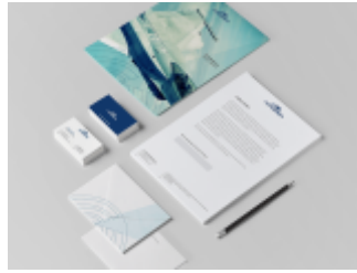
Identyfikacja wizualna oraz projekty reklam prasowych PIT-RADWAR SA