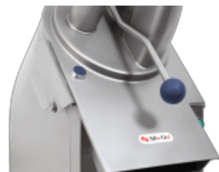
Szatkownica MaGa MKJ2-250 - szatkownica do warzyw