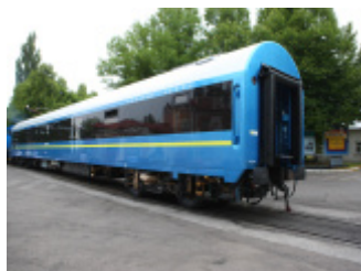
Wagon sypialny - wagon 7034 (RIC) dla kolei ukraińskich