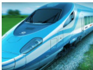
Pendolino - EIC Premium