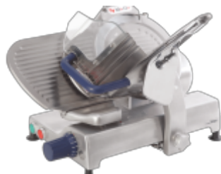
Krajalnica MaGa 310p2 - krajalnica grawitacyjna