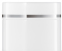
Słoiczki do kremów