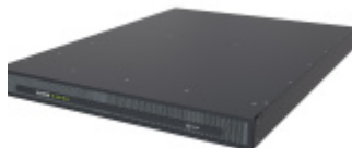
Obudowa urządzenia Roton