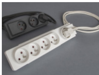
Przedłużacz - PLM- 502-13 ELGOTECH dla Leroy Merlin