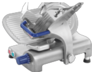
Krajalnica MaGa 210p - krajalnica grawitacyjna