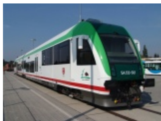
Autobus szynowy 218C