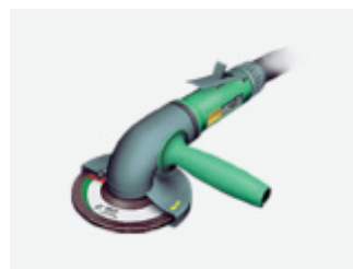
Narzędzia ręczne z napędem pneumatycznym