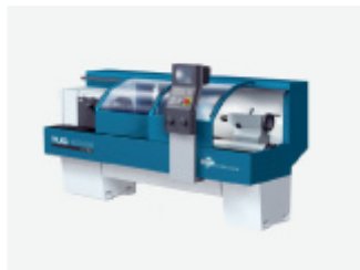
Tokarka uniwersalna ze sterowaniem numerycznym TUG 40MN