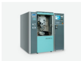
Wycinarka drutowa modułowa MEWIOS 20