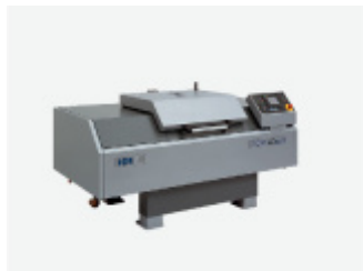
Drążarka elektrochemiczna ECM 4Diana