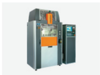
Drążarka elektroerozyjna modułowa MEDIOS 30