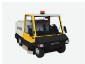
Zamiatarka uliczna dwuosobowa