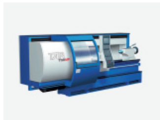
Rodzina tokarek TAR