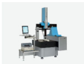
Maszyna pomiarowa trójkoordynatowa Linea