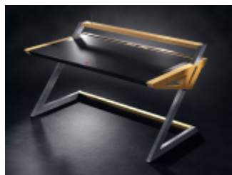
FUNCTIONAL TABLE Concept