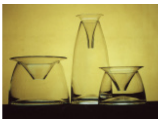
ZESTAW WAZONÓW WANDA