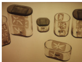
MONIKA - zestaw naczey toaletowych