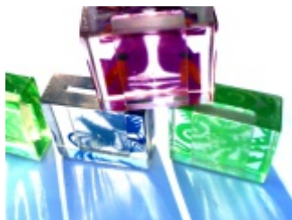
OPAKOWANIE DLA KARTY Z NOŚNIKIEM DANYCH