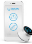
Bezprzewodowy stetoskop StethoMe