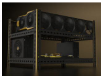
Obudowa koparki kryptowalut