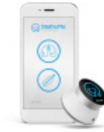
Bezprzewodowy stetoskop StethoMe