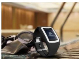
Zegarek pływacki Swimmo