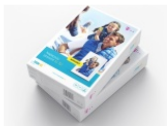
Ramka cyfrowa ZOOM.ME