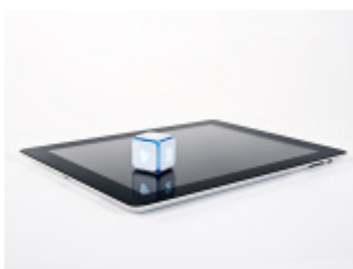
Kostka elektroniczna DICE+