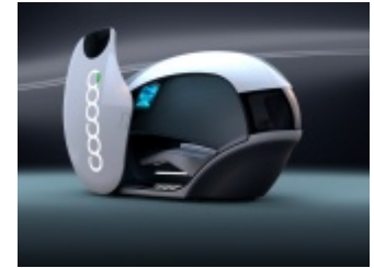
Kapsuła wypoczynkowa Cocoon