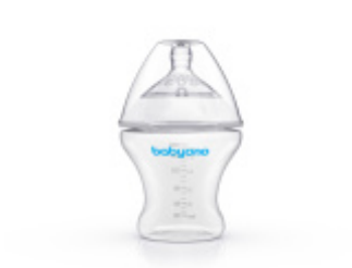
Seria butelek NATURAL NURSING