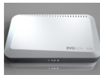
Dekoder EVOBOX PVR