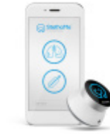
Bezprzewodowy stetoskop StethoMe