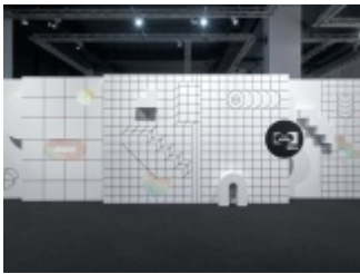
Projekt i realizacja wystawy DOBRY WZÓR (lata 2011-2016)