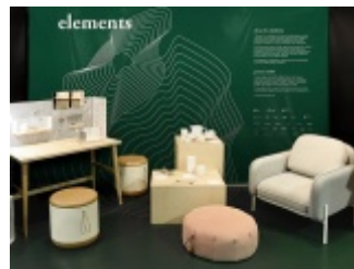
"ELEMENTS" - wystawa projektów Grynasz Studio na Tokyo Design Week