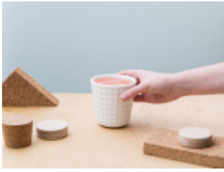
CZARKA - naczynie ceramiczne