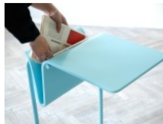
KAWA + GAZETA - stolik kawowy z gazetownikiem