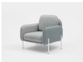
CORBU - rodzina sof i foteli