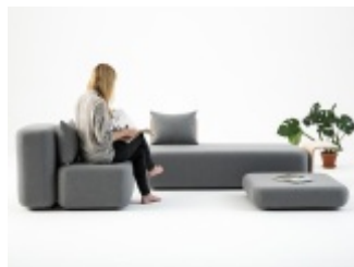
KUBU - sofa modułowa