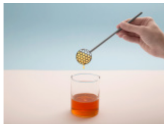
MIODOWNIK - łyżeczka do miodu