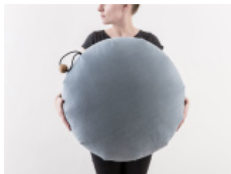
CORAL - pufa