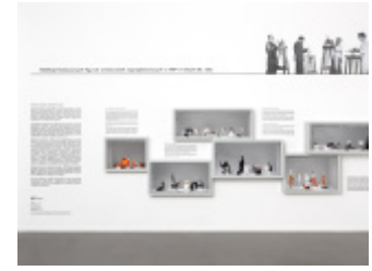
Projekt i realizacja ekspozycji kolekcji figurek ćmielowskich zaprojektowanych w IWP w latach 50. i 60.