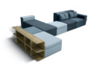
MODULOR - sofa modułowa