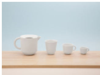
CZAJ - rodzina porcelanowych naczyń do serwowania kawy i herbaty