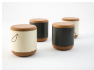
SLOW - siedzisko