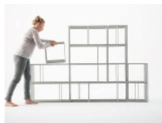
PROM - regał modułowy