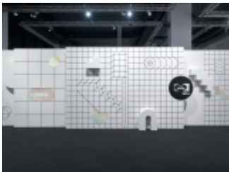
Projekt i realizacja wystawy DOBRY WZÓR (lata 2011-2016)