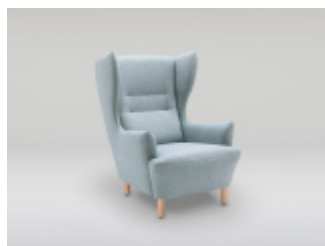
MUNO - fotel