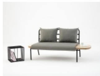
LAWA - sofa