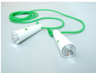
LolliLED - skakanka-latarka