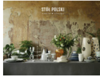
Projekt i realizacja wystawy "STÓŁ POLSKI / LA TAVOLA POLACCA" / EXPO Milano 2015