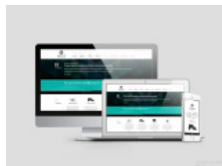
Projekt strony internetowej oraz materiałów reklamowych