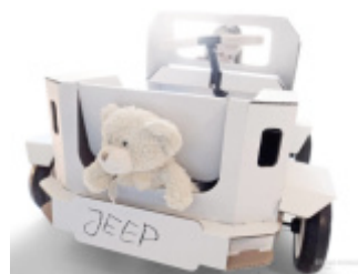
Zabawka wielofunkcyjna dla dzieci