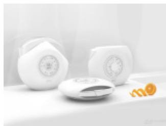
Projekt sprzętów AGD - czajnik, toster i opiekacz