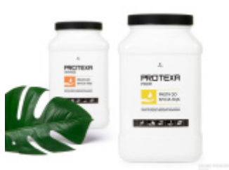
Projekty etykiet na opakowania środków przemysłowych