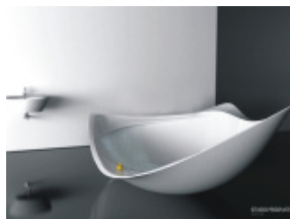
Wanna i prysznic 2w1