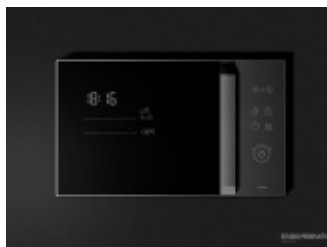
Projekty sprzętów AGD - kuchenka mikrofalowa i płyta indukcyjna