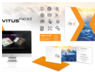
Kasa Novitus Next