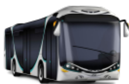
Autobus City Smile (teraz URSUS, dawniej marka AMZ Kutno)