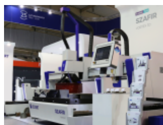
SZAFIR VORTEX 3D (maszyna CNC)