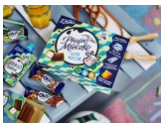
Ptasie Mleczko Wedel