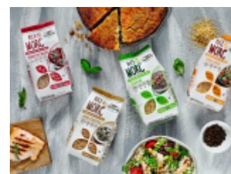
Rice & More Monini