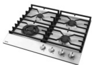
Płyta gazowa Amica