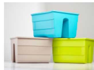
Donica balustradowa FALA