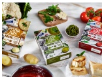
Pyszna Zupa Poltino