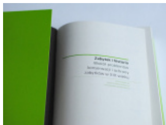
Akademia Zarządzania Muzeum