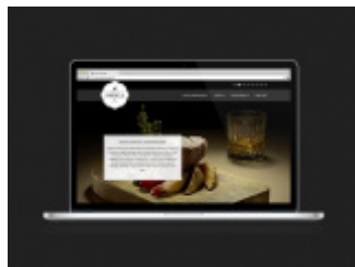
Identyfikacja restauracji Szara Eminencja