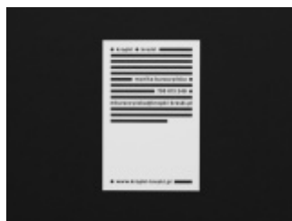
Identyfikacja wizualna Kropki Kreski