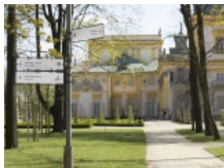
System informacji i identyfikacji wizualnej Muzeum Pałacu w Wilanowie