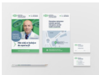
Identyfikacja wizualna Centrum Operacji Zaćmy