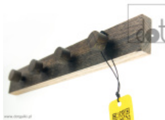
Wieszak kuchenny / łazienkowy