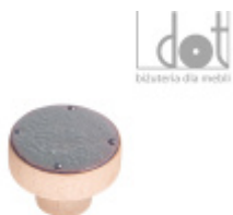
Gałka meblowa emaliowana