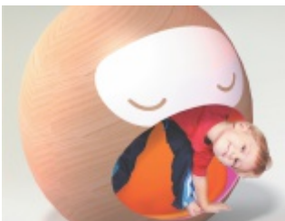
Mebel Marzeń 2015