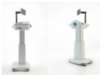
Luna EMG robot rehabilitacyjny