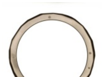
Czarny Dąb / Wiśnia / Jabłoń