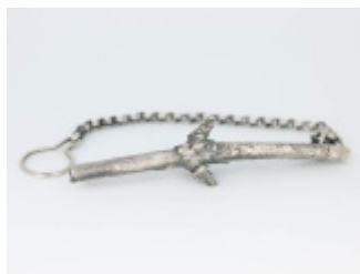
Gałązki / Obiekty Znalezione / Męska Biżuteria