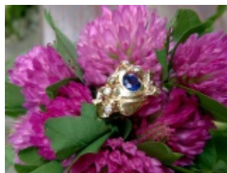
Szafir i Diamenty