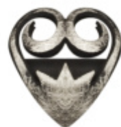
Kwiatki Skole i Korole