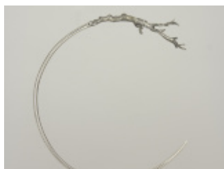
Obiekty Znalezione // Kolekcja Biżuterii