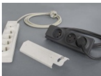
Przedłużacz - PLM- 502-13 ELGOTECH dla Leroy Merlin