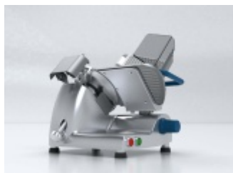
Krajalnica Ma-Ga 210p