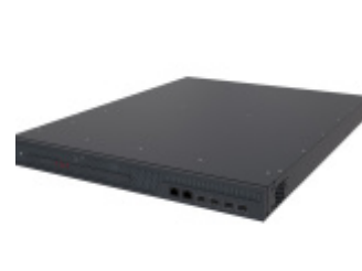
Operatorskie stacje czołowe ROTON i TANTRAX