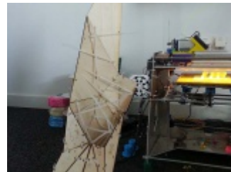
"Duże zwierzę" - Żubr Fabian