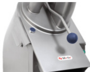
Szatkwonica do warzyw Ma-Ga MKJ2