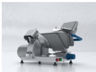
Krajalnica Ma-Ga 310p