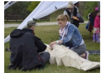
"Duże zwierzę" - Gigantorak