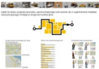
"Kompan" - projekt studyjny