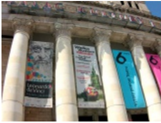
Wystawa „Geniusz Leonardo da Vinci”